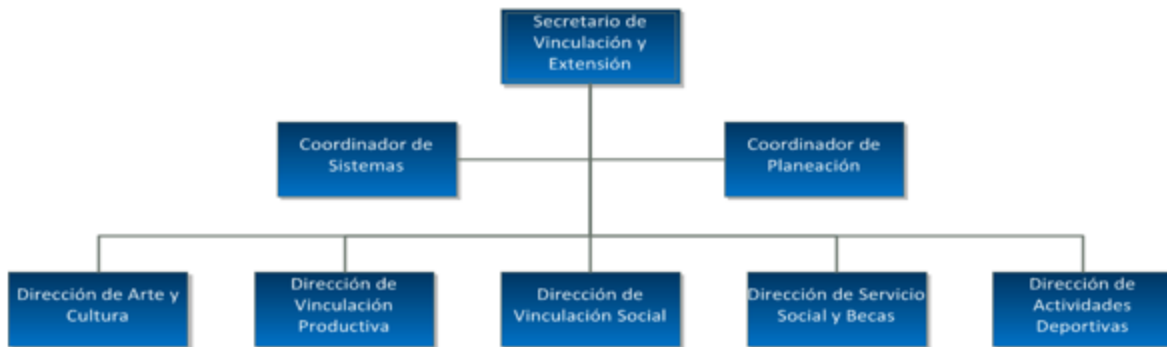
Figura 4.1 Estructura organizacional de la Secretaría de Extensión y Vinculación de la UAN.